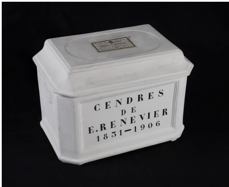
L'urne avec les cendres Eugène Renevier.